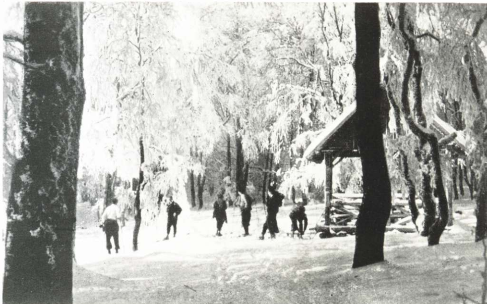
SIELŐK A KÉKESHEGYEN.

A szőlőnemesítés fellendülése a legjobb jövőt ígérte, amikor bekövetkezett a nagy világháború; de a város nemcsak anyagi és véráldozatot tett a haza oltárára; 1917 május 21-én kigyuladt a város s napokon át égve alsó része egészen elpusztult. Harmadnap a királyi pár is meglátogatta az üszkők szomorú fészket. A törvényhozás megalkotta a város rendezésére és felépítésére az 1918. XXIII. törvénycikket, elkészült a nagyszerű rendezési terv és jogszabály-gyűjtemény, felépült szerényebb alakban a Szent Bertalan-templom,