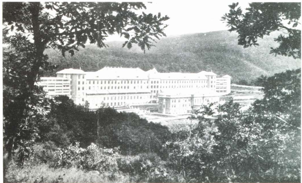
HORTHY MIKLÓS-SZANATORIUM A MATRÁBAN.

Az abszolutizmus éveiben az összeütközés a nemcsak politikailag, de gazdaságilag is elnyomott városi polgárság és a földesúri érdekek között mind gyakoribbá válik és kiélesedik. A gyöngyösiek a papi dézsmától 1848-ban megmenekülve, kétszeresen terhesnek érezték