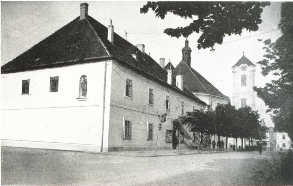
A RÉGI GYMNASIUM.

Megemlítem végül, hogy az ifjú Mátyás király 1461-ben jár Gyöngyösön, a cseh huszitákat űzve ki a Zagyva mentéről s hogy II. Ulászló kétszer, II. Lajos pedig egyszer (1520) látogatja meg a várost.