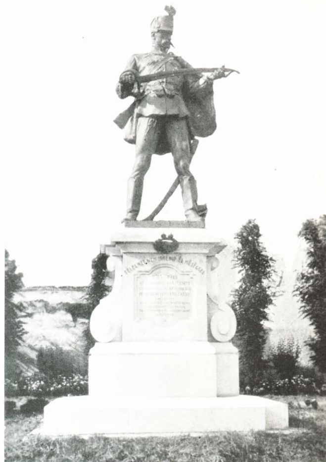
A 6-OS HUSZAROK HŐSI EMLÉKSZOBRA.

A város azóta részben felépült romjaiból, elkészítette a vízvezetékét és villamosvilágítást, utakat épített s Isten segítségével bízva, önerejére támaszkodva néz a jövő elé.