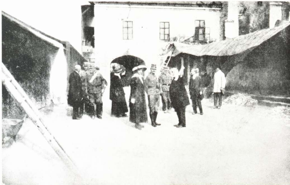
A GYÖNGYÖSI TŰZVÉSZ UTÁN A KIRALYI PÁR A VÁROSHÁZA UDVARÁN.