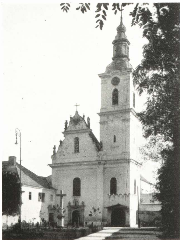
SZENT FERENC-RENDIEK TEMPLOMA.

Különleges helyzetével függ össze az is, hogy új birtoka benépesítésére törekedve 1334 május 5-én azon kiváltságot eszközölte ki a királytól Gyöngyös részére, hogy annak lakói Buda város jogaival élhessenek: falakkal keríthessék be a lakott területet, tornyokat, erősségeket emelhessenek.