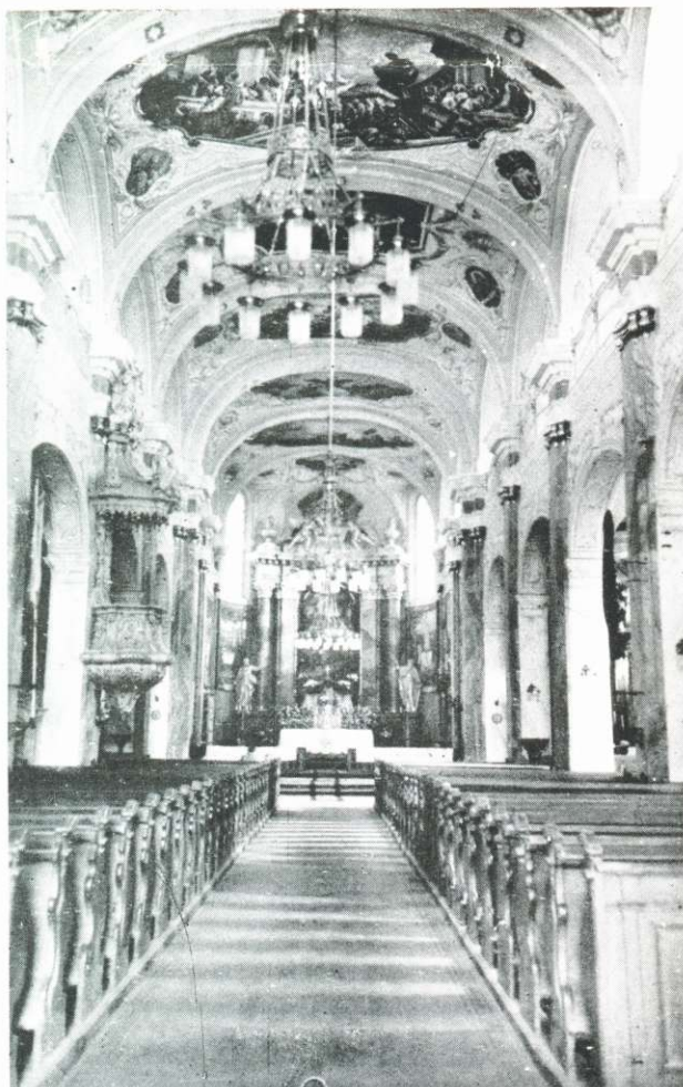
SZENT BERTALAN-TEMPLOM BELSEJE.

Igen régi a tímárok, kovácsok és kerékgyártók céhei, 1634-ben foglalták írásba szabályaikat a csizmadiák, az ácsok, kőművesek és kőfaragók 1650-ben, a kéményseprők még korábban. Mindez arra vall, hogy a város ipari élete a XVII. században indult lendületnek.