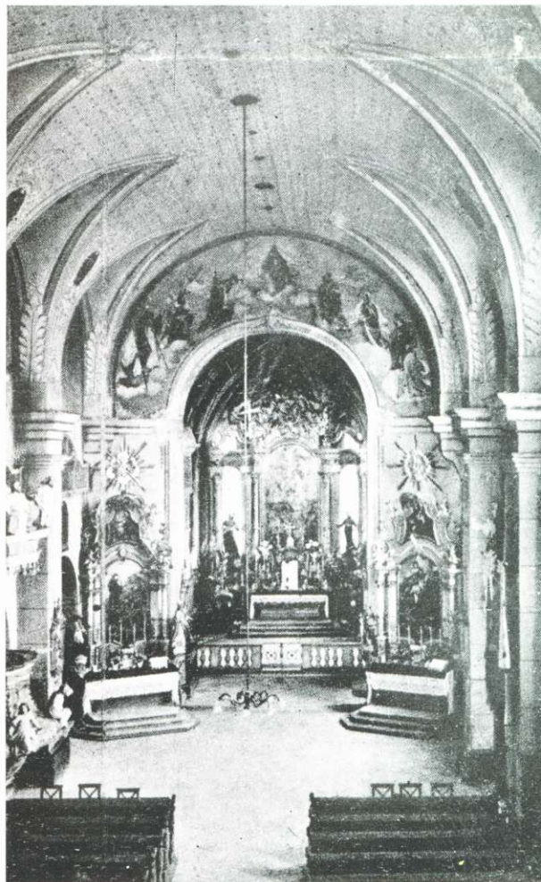
SZENT FERENC-RENDIEK TEMPLOMANAK BELSEJE.